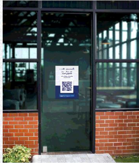
■ واجهة المنشأة