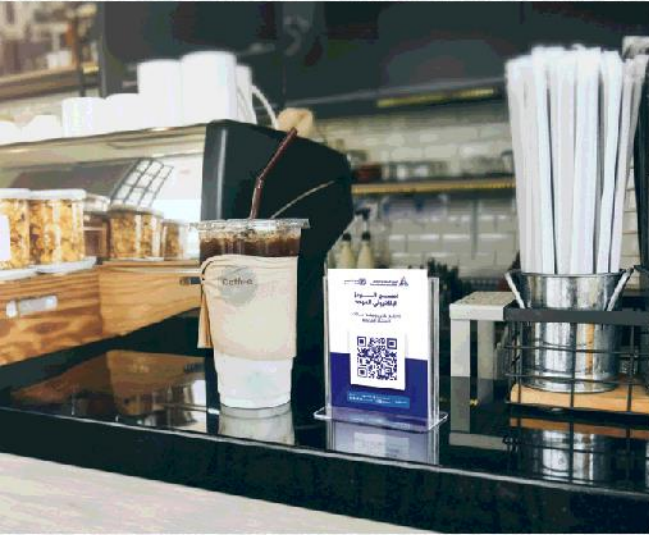
■ طاولة الاستقبال